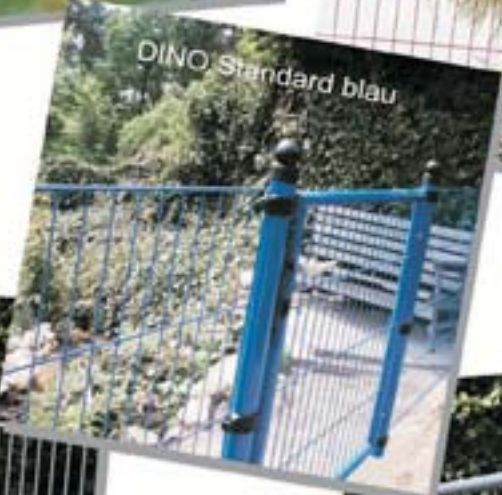
DINO Standard blau