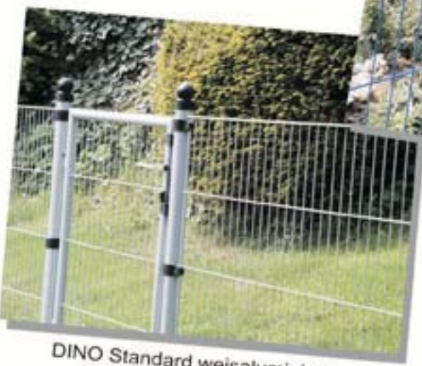
DINO Standard weisaluminium