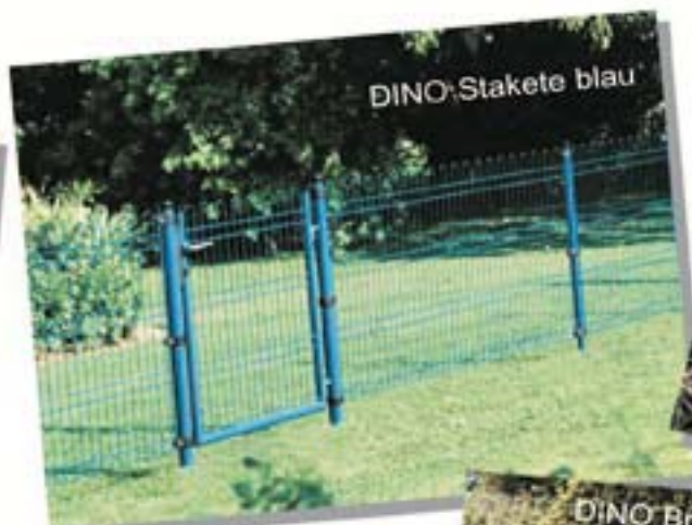
DINO Stakete blau