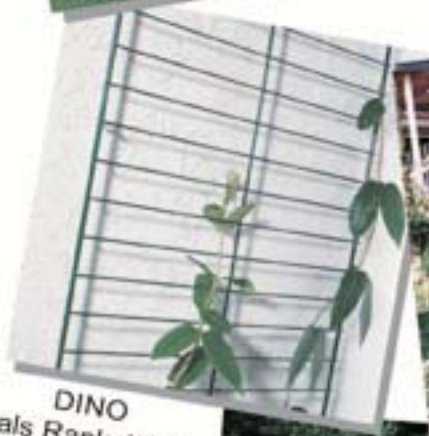
DINO als Rankgitter