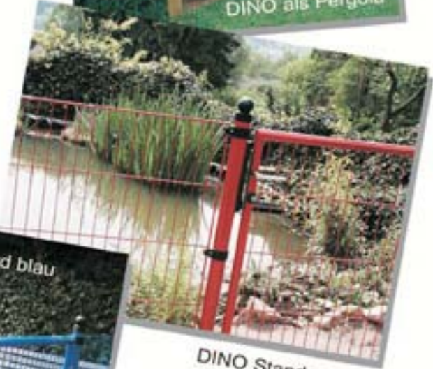
DINO Standard rot