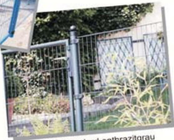
DINO Standard anthrazitgrau

mbausystem können Sie Artikeln auswählen?