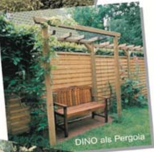
DINO als Pergola