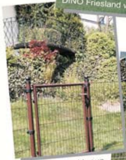
DINO Standard braun