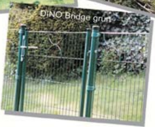
DINO Bridge grün