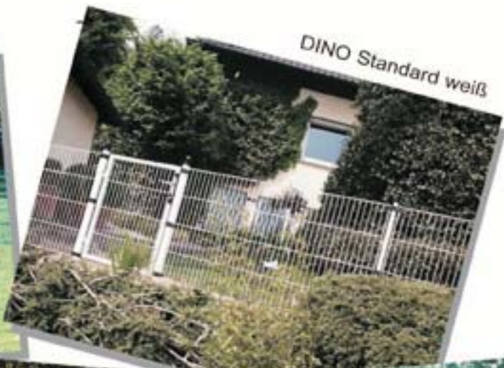
DINO Standard weiß