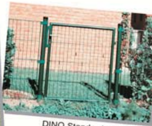
DINO Standard grün